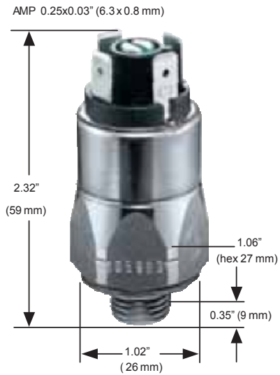
Abbildungen können von tatsächlich gelieferten Geräten abweichen