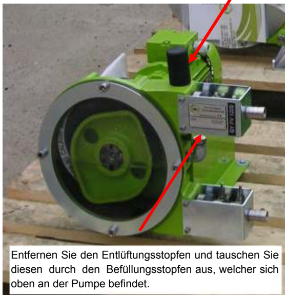
Entfernen Sie den Entlüftungsstopfen und tauschen Sie diesen durch den Befüllungsstopfen aus, welcher sich oben an der Pumpe befindet.

Der SUCO Druckschalter (Standard links, ATEX rechts) wird am Befüllstopfen der Pumpe verbaut. Er wird über eine mitgelieferte Reduzierung 1/2" Außengewinde auf 1/4" Innengewinde an die Pumpe montiert.